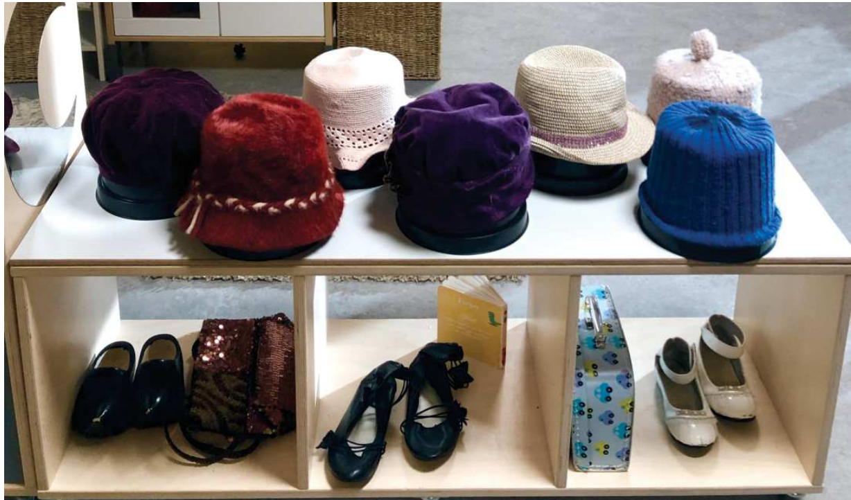
Figur 1. Nyåpning: Viser fleksibel innredning og presentasjon av ulikt lekemateriale

barn. Dette omhandler møbler, leker og annet løst materiell. I barnehagen gjennomfører de dette hver dag under ryddetid, hvor de har fokus på å ordne til spennende lekemiljøer for barna. Under kan vi se ulike bilder fra nyåpninger: