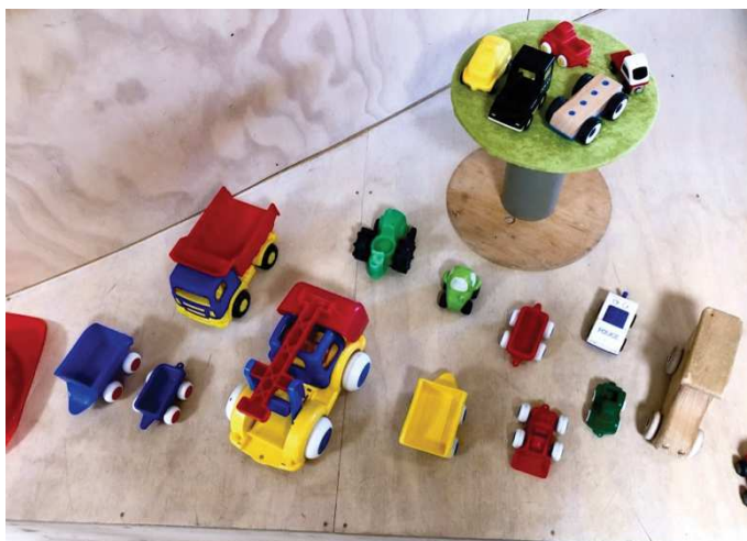
Figur 2. Nyåpning: utstilling av lekebiler