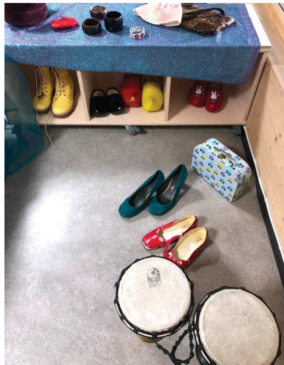
Figur 9. Nyåpning: Instrumenter