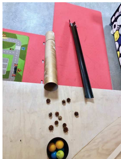
Figur 11. Natur og gjenbruksmaterialer

I denne observasjonen er det barn fra 1-2,5 år. Dette viser det Trageton (2007) beskriver som lek med materialer. De bruker konglene og takrennen sammen, og de utforsker disse materialene på ulike måter i situasjonen. Barna bruker her en divergent tenkning i form av å åpne for nye måter å bruke materialene på. Slik som Fønnebø (2014) nevner er personalet som inspirasjonskilde viktig for tilrettelegging av utforskning og lek, og dette kan bidra til mer kreativitet og fantasi blant barn. Denne observasjonen tolket jeg i form av at undringen barna hadde med seg inn i leken var sterk.