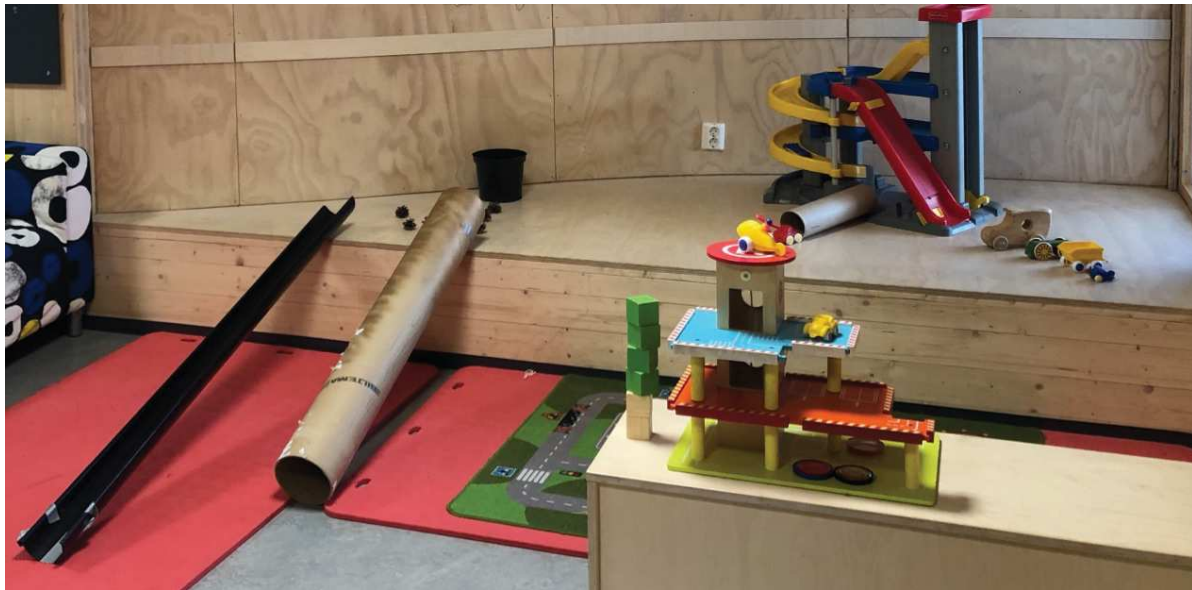
Figur 10. Nyåpning: Bilområdet