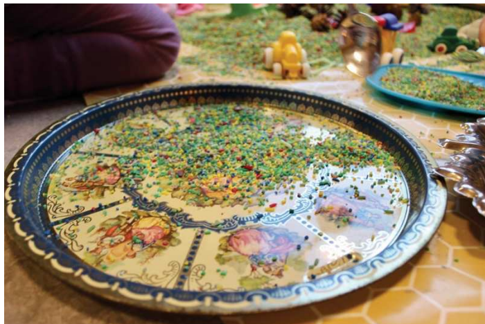
Figur 5. Sand som eksempel på ustrukturert lekemateriale

Trageton deler opp lekematerialer fra ustrukturerte til strukturerte leker, hvor han viser eksempler fra leire til StarWars -figurer. Han mener at strukturerte lekematerialer gir barnet mindre skapende og transformerende egenskaper. Ustrukturerte materialer, som sand og byggeklosser, kan dermed gi flere muligheter til fantasi og omforming til det barnet ønsker (2007, s.99-100). Fønnebø skriver at Trageton bidro til en ny tanke om hva som kan forstås som leker i barnehagen, og tok formskapning «ned på gulvet». Dette gjorde at barnehager åpnet øynene for at det ikke bare er fabrikkproduserte leketøy som gir utbytte for barn, men også andre material som formings og gjenbruks-materialer (2014, s.90). Slik som Birgitta K. Olofsson (1987) sa det «Barn behøver inte leksaker, man saker att leka med!» (Trageton, 2007, s.98).