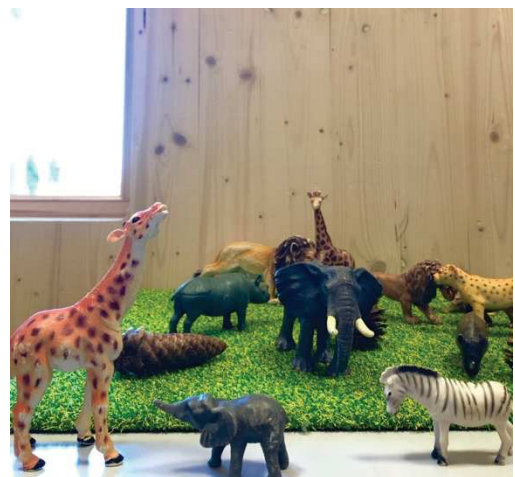
Figur 3. Nyåpning: utstilling av lekedyr