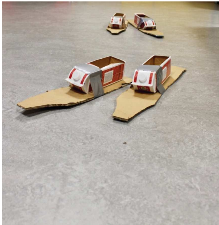
Figur 7. Nyåpning: Melkekartongski 2.