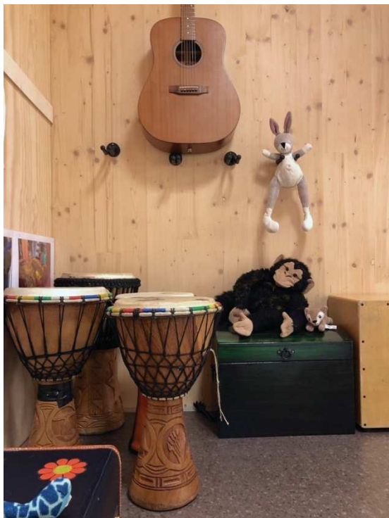
Figur 8. Musikkinstrument

Vi har for eksempel masse instrumenter fram til barna, dette er det nok ikke alle barnehager som har. Det er en fantastisk mulighet og virkningsfullt for barna. Barna kan kommunisere gjennom musikk. F.eks. gjennom tromme, her kan barn respondere på hverandre og få et samspill fort. Det sanselige er selvfølgelig en viktig del når man jobber med småbarn. Og språk og samspill generelt.